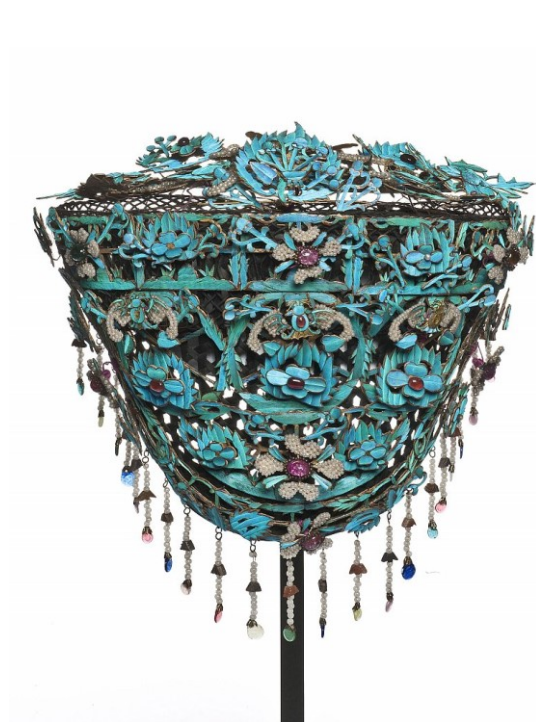
Parure de tête, Chine , dynastie Qing (1644-1912), XIXe

À la suite de « Dix mille ans de luxe », conçue en partenariat avec le Louvre Abu Dhabi en 2019, le Musée des Arts Décoratifs présente « Luxes ». L'exposition propose un voyage à travers le temps et la géographie,