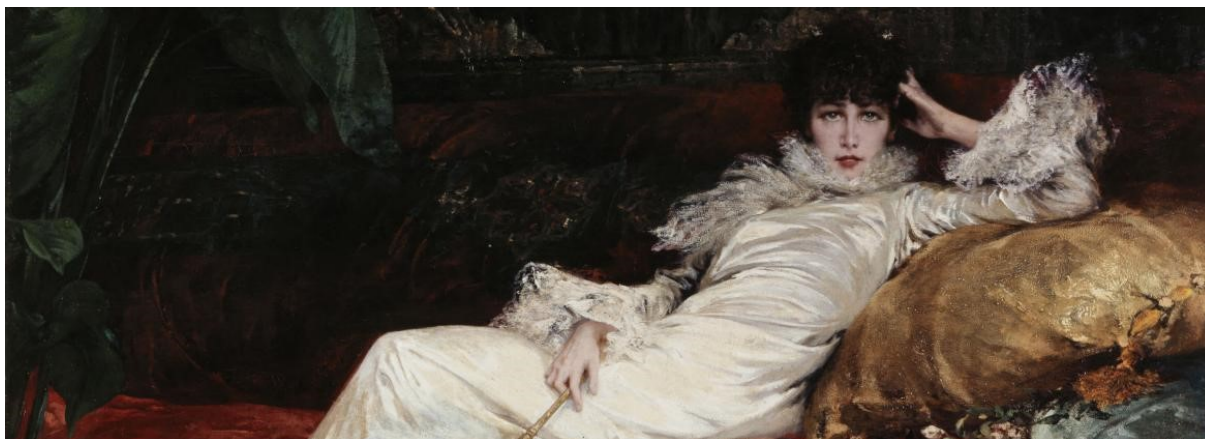
Figure emblématique du tournant des XIXe et XXe siècles, la « Divine » Sarah Bernhardt (1844-1923), actrice tout autant qu'artiste, fait l'objet d'une exposition tout à fait exceptionnelle au Petit Palais.

Le parcours de l'exposition retracera grâce à plus de 600 œuvres la vie et la carrière de ce « monstre sacré », terme inventé pour elle par Jean Cocteau et présentera également des aspects de sa vie moins connus comme son activité de peintre et d'écrivain mais surtout de sculptrice.